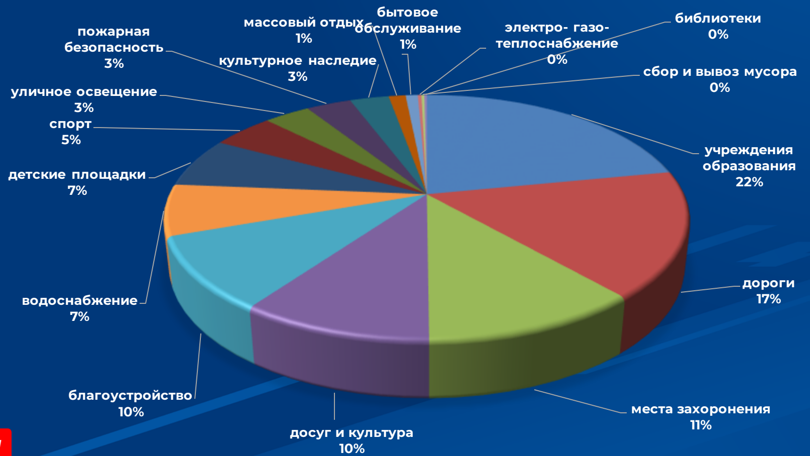
ТИПОЛОГИЯ ПРОЕКТОВ-ПОБЕДИТЕЛЕЙ ППМИ 2016-2023 ГГ.

NEW ПРОЕКТЫ, НАПРАВЛЕННЫЕ НА УЯЗВИМЫЕ СОЦИАЛЬНЫЕ ГРУППЫ И ГРАЖДАН С ОГРАНИЧЕННЫМИ ВОЗМОЖНОСТЯМИ